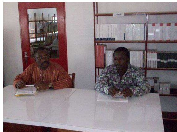
Le Président National de la CRT et le Coordinateur de la Région des Plateaux à l'ouverture de la rencontre

Après une présentation des activités réalisées par la Coordination de 2009 à ce jour et une autre portant sur le plan d'action / budget 2011, les participants ont eu la latitude de poser des questions pour s'imprégner davantage des expériences de la Région des Plateaux