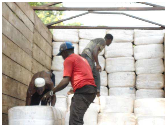
Chargement des moustiquaires pour Sokodé

Recevant les lots de moustiquaires, le Ministre de la Santé a remercié les généreux donateurs et promis que ces équipements iront à leurs destinataires et que bon usage en sera fait.