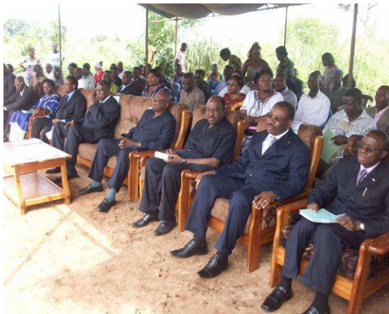
Vue partielle des autorités présentes à la cérémonie

Le site de l'entrepôt de la Croix-Rouge Togolaise à Tsévié (Togo) a servi de cadre le 30 Juin 2011 à une importante cérémonie de remise de moustiquaires au Ministère de la Santé.