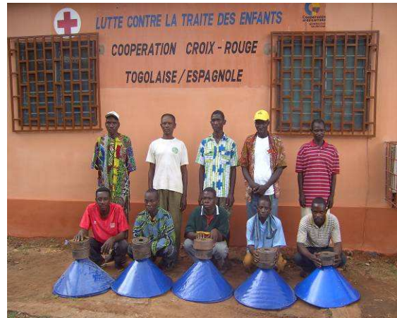
Des récipiendaires posant avec une partie du matériel reçu

Vo, des Lacs et de l'Avé avec chacune quatre (04) moulins.