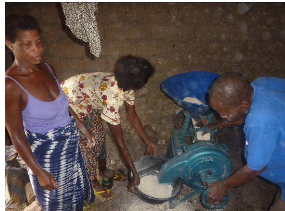
Séance de démonstration

Cette activité qui s'est déroulée à la satisfaction des populations bénéficiaires a été conduite d'une part par l'équipe du projet basée à Tsévié et celle de Lomé en collaboration avec les techniciens de la « Forge sans frontières », fournisseur des outils concernés.