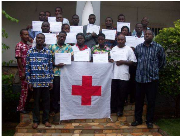
Les participants posant à l'issue de la formation