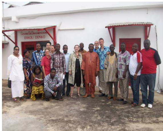
Photo de famille à l'issue de la présentation