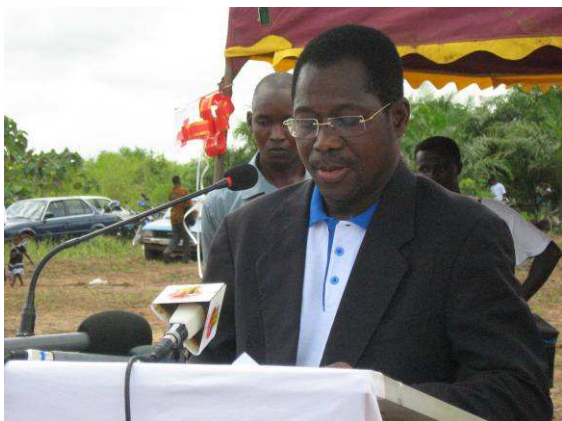
... et le Ministre de l'Environnement, s'adressant à l'assistance