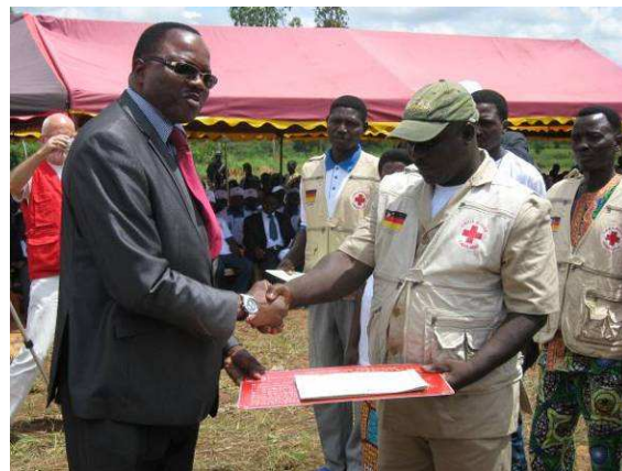
Le Ministre de la Sécurité et de la Protection civile remettant une plaque et des certificats aux membres de PC-teams

Les personnalités présentes à cette cérémonie ont salué la pertinence des actions menées par la CRT et ses partenaires dans l'accomplissement de sa mission, celle de prévenir et d'alléger les souffrances humaines.