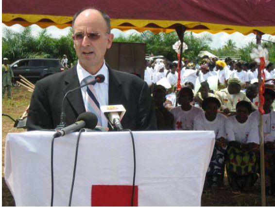
... l'Ambassadeur d'Allemagne au Togo...