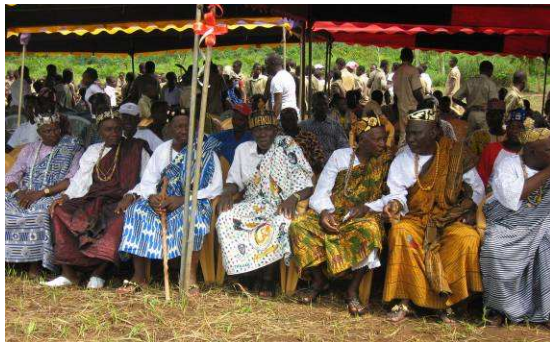
Plusieurs personnalités ont pris part à la cérémonie

Plusieurs fois victimes des inondations, les familles de sept villages de la préfecture de Yoto disposent désormais des habitations en zone non-inondable avec des infrastructures de base.