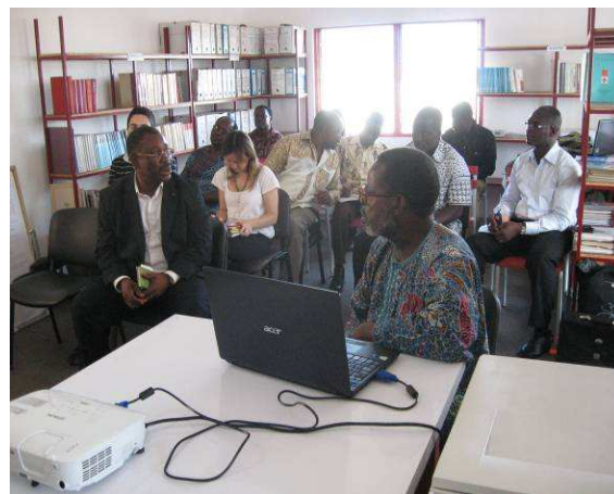
L'assistance pendant la présentation des résultats de l'évaluation

Après ses études et ses missions sur le terrain, le cabinet a produit un rapport dont les résultats ont été présentés à la CRT le mercredi, 12 Octobre 2011.