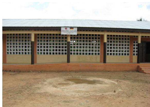
Vue partielle de la façade du CEG