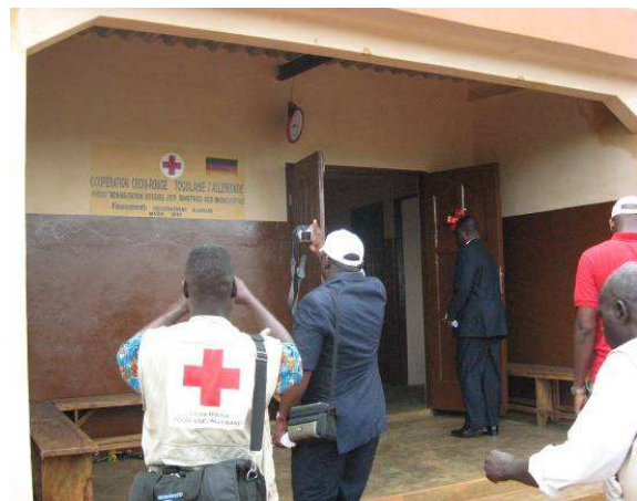
Vue partielle de la façade du dispensaire