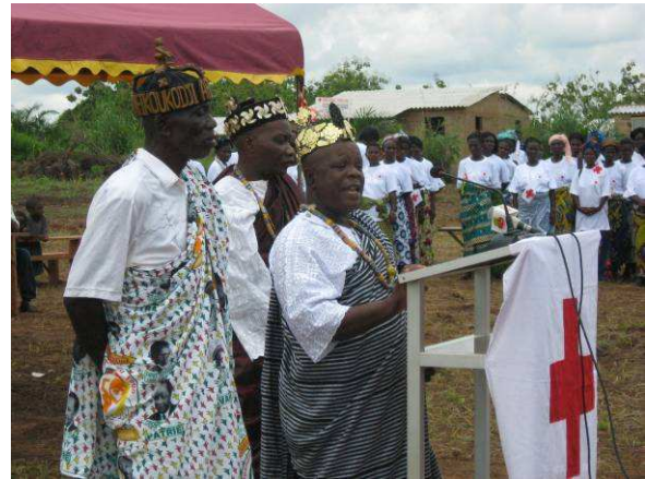
Des Chefs du canton de Tokpli (ci-dessus) et le Président du Comité Régional de la CRT/Maritime (ci-dessous), souhaitant la bienvenue aux invités

par le Gouvernement allemand à hauteur de 517.000 Euros.