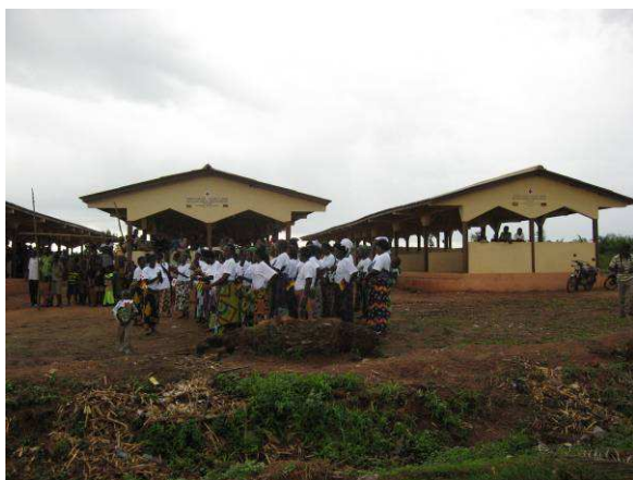
Vue partielle des hangars du marché

Rappelons que ce projet piloté par la Croix-Rouge Togolaise et Allemande a concerné les villages de Kpodji, Logokpo, Doumassikondji, Tchakponou, Ahlemegninkondji, Dégoukondji et Atakpamédé.