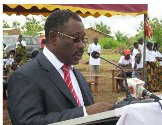
Le Président PANIAH ...

Des outils aratoires et des engrais ont été remis aux ménages des localités sinistrées ainsi que des certificats aux volontaires de l'équipe de préparation aux catastrophes.