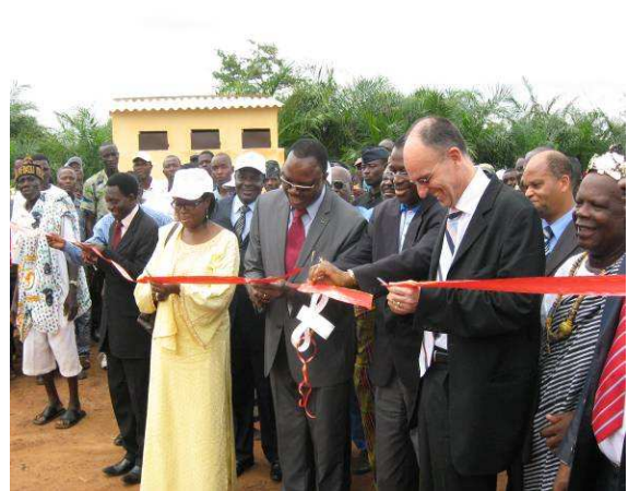
Coupure du ruban symbolique