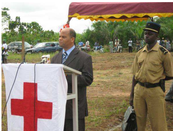
Le Préfet de Yoto lors de son mot de bienvenue