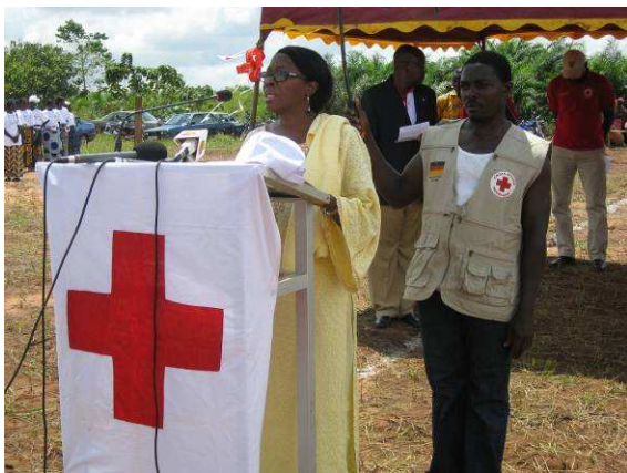
... la Coordinatrice du Système des Nations-Unies...